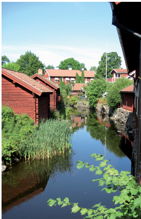
Bebyggelse runt ån.

För Norbergs kommun är det främst faktorerna fritidsmöjligheter och kommunikationer som kan förbättra kommuninvånarnas betyg.