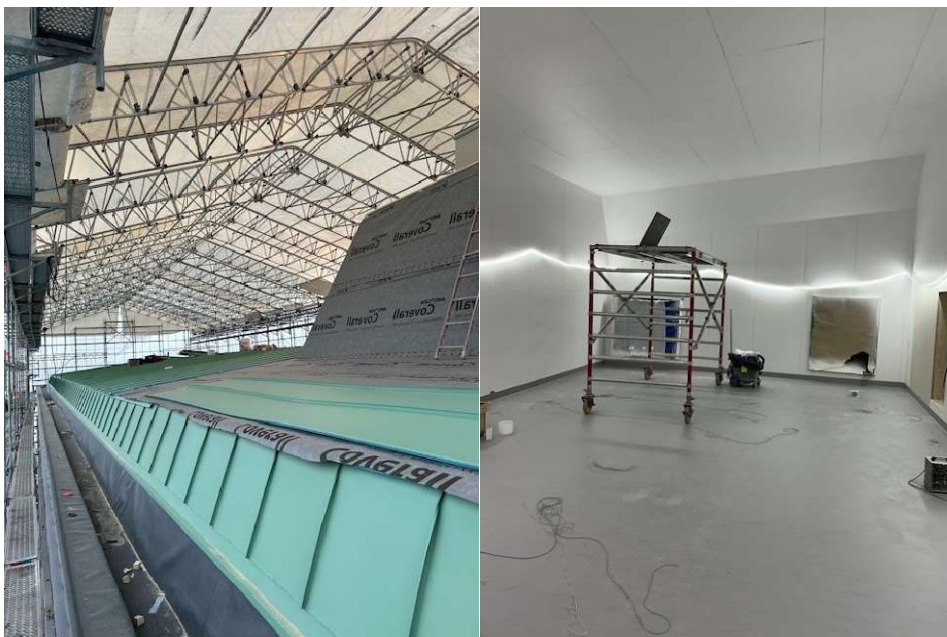
Vy från taket och fläktrum under färdigställande

På taket är fläktrummet nästan klart och plåtarbetet pågår för fullt.