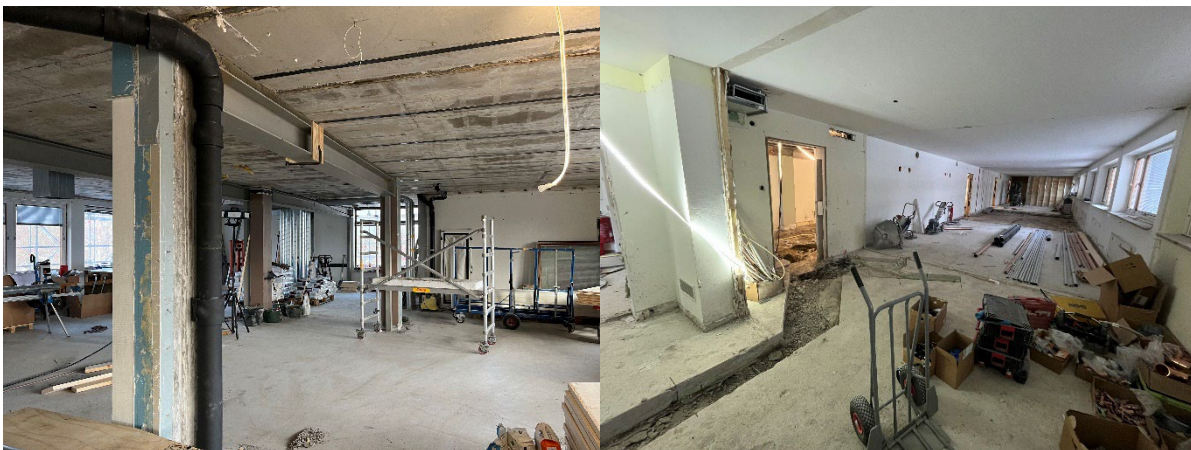
Återuppbyggnad, förstärkningar och installationsarbete.