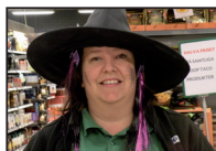
... och My har fått en ny batt.....